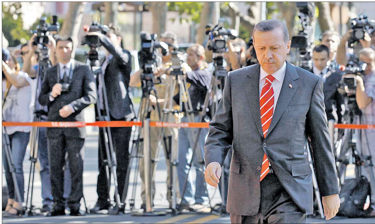
Der türkische Premier Erdoğan setzt auf Konfrontation mit Israel, um Punkte in der arabischen Welt zu sammeln.